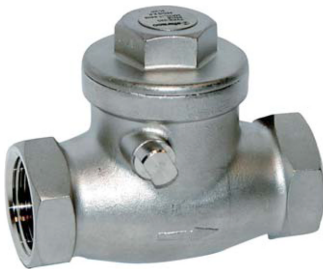
inox terugslagklep PN16 met flapper / zonder veer fig 712 : FF 1/2" - 2" bsp teflon klepring temp. : -30°C +180°C max. 16 bar bij 120°C max. 10 bar bij 180°C fig 712NPT : met NPT draad