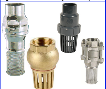
voetkleppen met filterzeef fig 791 : messing/NBR : FF 1/2" - 4" bsp temp. : 0°C +90°C fig 792 : inox/inox : FF 3/8" - 4" bsp veer 3-delig huis / temp. : -30°C +200°C fig 793 : inox/viton : FF 1/2" - 4" bsp veer temp. : -25°C +150°C fig 732 : PVC/EPDM : 20-63 mm lijmeinden veer temp. : 0°C +60°C