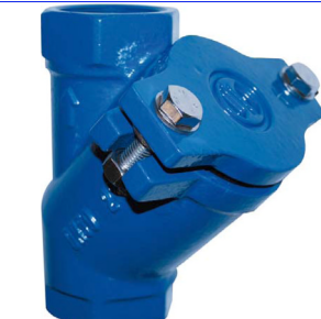
nodulair gietijzeren balkeerklep PN10 huis : GGG40 fig 770 FF 1" - 3" bsp bal NBR rubber tot 6/4" bal aluminium met NBR coating > 6/4" temp. : -30°C +180°C