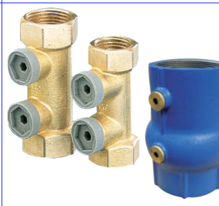
BELGAQUA gekeurde terugslagklep PN10 EA keerkleppen pollustop : FF 1/2" - 2" bsp in messing FF 2 1/2" - 3" bsp in gietijzer messing : temp. : max +80°C gietijzer : temp. : max +100°C 2 afgeplugde boringen veer in inox