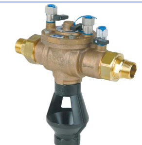
BELGAQUA gekeurde terugslagklep PN10 BA terugstroombeveiliging MM 1/2" - 2" bsp huis messing ontlastklep : polymer PA kleppen : polymer POM temp. : max. +65°C