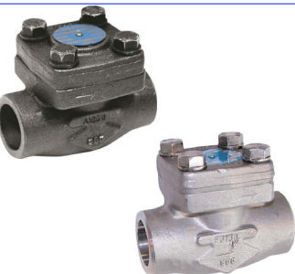
terugslagkleppen ansi 800 lbs piston type fig 721.1 : staal 3/8" - 2" npt fig 721.1bsp : staal 3/8" - 2" bsp fig 724.1 : staal 3/8" - 2" SW-laseinden bal type fig 722.1 : staal 3/8" - 2" npt fig 725.1 : staal 3/8" - 2" SW-laseinden fig 721.3 : inox 316 / 3/8" - 2" npt fig 725.3 : inox 316 / 3/8" - 2" SW-laseinden