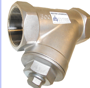
inox terugslagklep PN40 met inox 316 veer fig 719 : FF 1/4" - 2" bsp teflon klepring temp. : -30°C +180°C