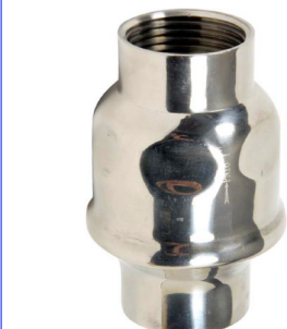
inox terugslagklep PN16 met inox veer inox klep en viton klepzitting temp. : -10°C +150°C FF 1/4" - 4" bsp fig 713 : in inox 304 fig 714 : in inox 316