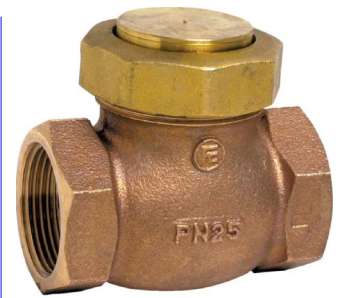
bronzen terugslagklep PN25 met inox veer inox klep en klepzitting temp. : -10°C +200°C fig 717 : FF 1/4" - 2" bsp