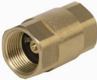
messing terugslagklep PN25/12 met veer fig 704 : FF 3/8" - 4" bsp NBR rubber afdichting temp. : -10°C +90°C inox veer fig 704NPT : met NPT schroefdraad fig 704CHROOM : verchroomd