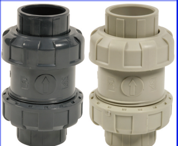
PVC / PP veerterugslagkleppen PN10 PVC uitvoering : max. +60°C / PP max. +80°C fig 730 : PVC/EPDM dichtingen / 1/2"-2" bsp fig 731 : PVC/EPDM dichtingen / 20-63 lijmm fig 733 : PVC/VITON dichtingen / 1/2"-2" bsp fig 734 : PVC/VITON dichtingen / 20-63 lijmm fig 740 : PP/EPDM dichtingen / 1/2"-2" bsp fig 741 : PP/EPDM dichtingen / 20-63 lijmm fig 743 : PP/VITON dichtingen / 1/2"-2" bsp fig 744 : PP/VITON dichtingen / 20-63 lijmm