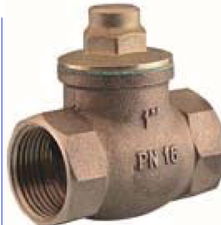
bronzen terugslagklep PN16 met inox veer teflon klepafdichtingsring temp. : -10°C +200°C fig 716 : FF 3/8" - 2" bsp