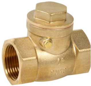
messing terugslagklep PN10 met flapper / zonder veer fig 711 : FF 3/8" - 4" bsp rubber beklede klep 3/8" - 2" : met EPDM rubber / -10°C +90°C 2 1/2" - 4" : met NBR rubber / -10°C +80°C fig 710 : FF 3/8"-4" bsp metaal/metaal dichtend fig 710NPT / fig 711NPT : met NPT draad