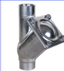
inox balkeerklep PN16 huis inox 316 fig 773 : FF 5/4" - 2" bsp bal aluminium met viton coating temp. : -30°C +180°C fig 774 : FF 5/4" - 2" bsp bal aluminium met NBR coating temp. : -30°C +90°C